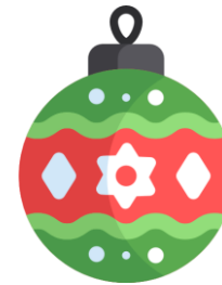
BOLA DE NAVIDAD